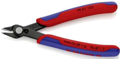
Elektronik Seitenschneider klein (Tool_004)