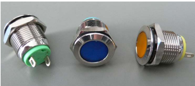
Kontrollleuchten mit Lötanschluss