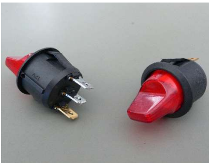
beleuchteter Kippschalter 12V (SW0003)