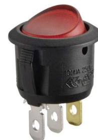
beleuchteter Wippschalter rot (SW0002)