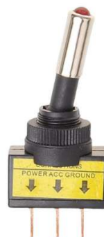
Kippschalter mit beleuchteter Hebelspitze rot (SW0001)